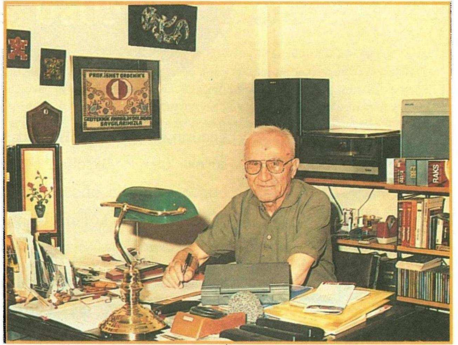
▲ Prof. İsmet ORDEMİR

Yaşımız icabı bazı şeyler gördük. Atatürk dönemini gördük. Cumhuriyetin 10. yılını kutladığımız zaman Atatürk hayattaydı ve bundan 64 yıl önceydi, 10. yılı dün gibi hatırlıyorum. Halbuki hatıralar o kadar canlı değildir. Öyle canlı, coşkulu bir kutlama